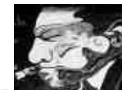
Öbacka Jazz & Blues

Vi reserverar oss för eventuella ändringar i programmet.