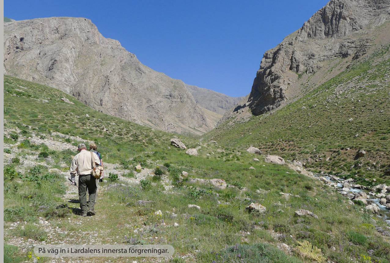
På väg in i Lardalens innersta förgreningar.

nan i väst, och den Indo-Asiatiska i öst, och har element från alla dessa delar. Stora delar ligger på hög höjd och öknar utgör en stor del av landets areal. Dessa miljöer har visat sig vara särskilt lämpade för huggormar och ökenlevande släkten såsom Cerastes , Echis , Eristichopsis , och Pseudocerastes , är alla representerade där. Förutom ett besök i Lardalen och Elburzbergen i norr planerades även besök i nordvästra delarna av Zagrosbergen (Fig. 1). I dessa regioner hoppades vi få se Montivipera raddei kurdistanica (NILSON & ANDRÉN 1985) och Montivipera albicornuta (NILSON & ANDRÉN 1985). Båda arterna beskrevs av Claes och Görän men ingen av dem hade lyckats hitta dem i Iran. Dessutom hade det relativt nyligen beskrivits ytterligare en art av bergshuggorm från Iran: Montivipera kubrangica (RAJABIZADEH, NILSON & KAMI 2011). Denna art var då känd i endast två exemplar, men Jan hade nyss fått se bilder på ytterligare någon individ. En utstickare till centrala Zagrosbergen blev därför ett måste. Utöver dessa bergshuggormar hade vi även chans på ängshuggorm ( Vipera (eriwanensis) ebneri (KNOPFLER & SOCHUREK 1955)), levanthuggorm ( Macrovipera lebetina obtusa (DWIGUBSKY 1832)) och