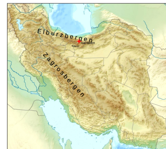
Fig 1: Topografisk karta över Iran. Lardalen är markerad med en stjärna.