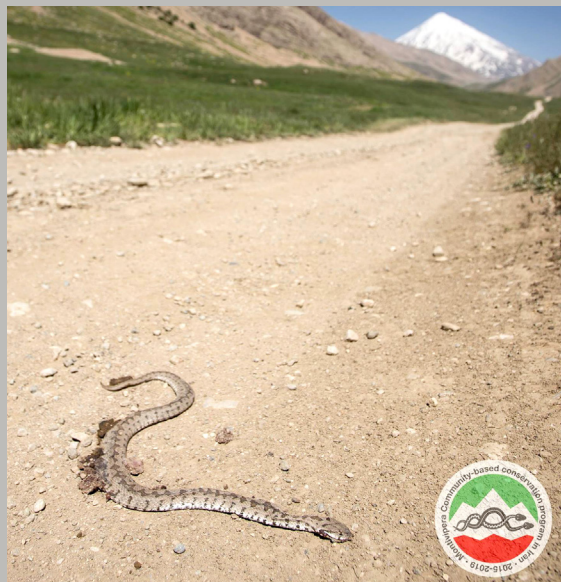
Ovan, vänster: Kontrollstationen vid entrén till Lar National Park. Utländska besökare behöver tillstånd för att passera. Vänster: Barbod Safaei-Mahroo informerar besökare till Lardalen. Ovan: En trafikdödad Latifis huggorm.